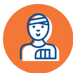
Le patient traceur

Chaque critère est évalué par une ou plusieurs des cinq méthodes suivantes :