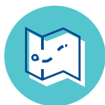
Le parcours traceur