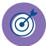
Le traceur ciblé