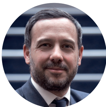
ADRIEN TAQUET Secrétaire d'État

Cette stratégie sera également un lieu de dialogue entre l'État et les départements. À rebours d'une vision rigide et datée des enjeux de répartition des compétences (et donc des financements), mon souhait est que nous puissions, de manière pragmatique, améliorer les pratiques et les modes de faire, pas à pas et de manière concrète, sur des sujets aussi essentiels que les délais d'exécution des mesures de justice, les déplacements multiples que subissent certains enfants, le suivi en santé, les impasses de la prise en charge du handicap et de la santé mentale en protection de l'enfance.