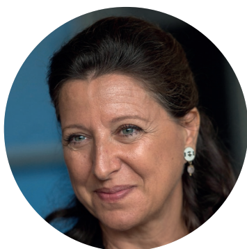
AGNÈS BUZYN Ministre des Solidarités et de la Santé

La stratégie présentée dans ce document illustre également un objectif transversal accompagnant la construction du système de protection de l'enfance du XXI ème siècle, celui d'adapter chaque procédure et chaque accompagnement aux besoins, pour remettre l'humain au centre.